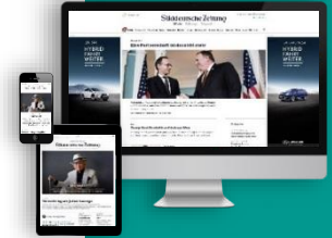
Beispielseite Süddeutsche Zeitung

Druckunterlagenschluss: 29. November 2019 17. Januar 2020